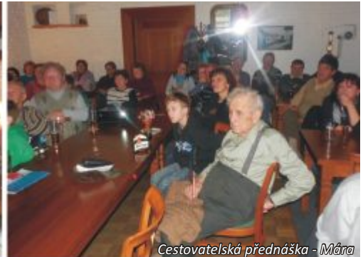
Cestovatelská přednáška - Mára