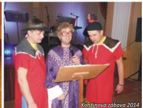
Končínová zábava 2014