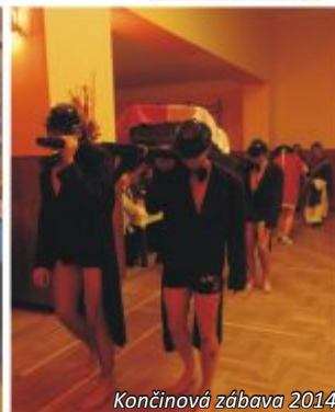
Končínová zábava 2014