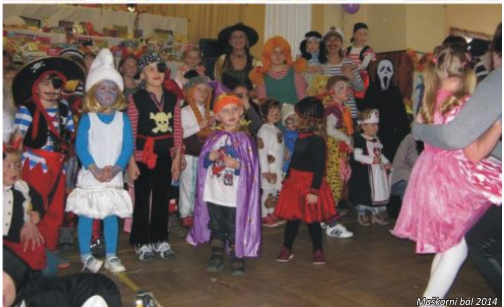
Maškarní bál 2014