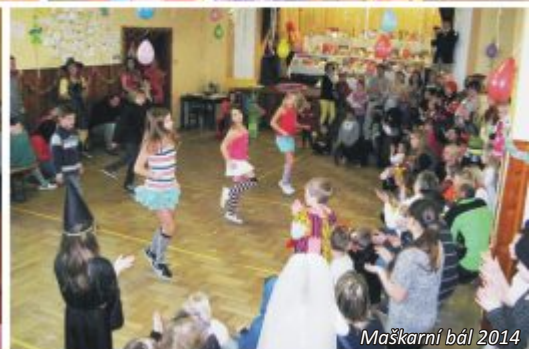
Maškarní bál 2014