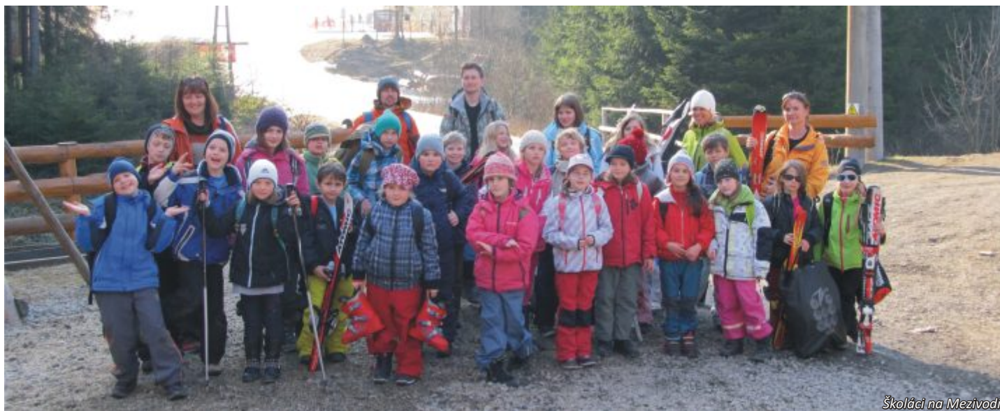
Školáci na Mezivodí

Na sních byla uplynulá zima mimořádně skoupá. Přesto si ho školáci na poslední chvíli nakonec užili. V krásném jarním počasí se vypravili lyžovat do beskydského areálu Mezivodí a akce se vydařila skvěle. Na prázdném svahu a pod azurovou oblohou si zajezdili na lyžích i snowboardu, nechyběl dvoukolový závod ve slalomu a své první krůčky na lyžích si vyzkoušeli začátečníci.