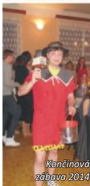
Končínová zábava 2014