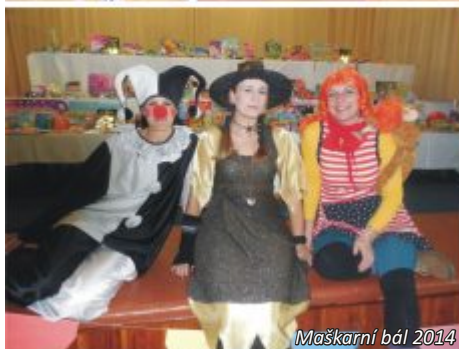
Maškarní bál 2014