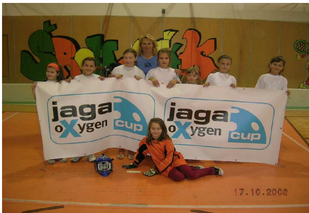
Krajské kolo ve florbalu v Hranicích