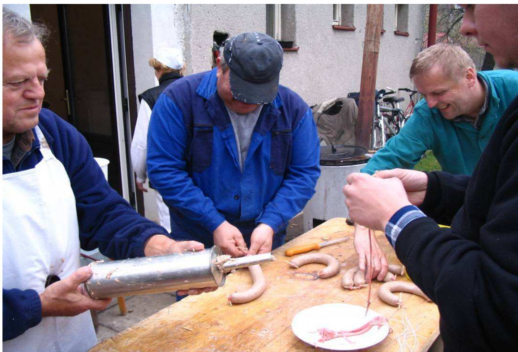
Skaličské hody – výroba jitniček