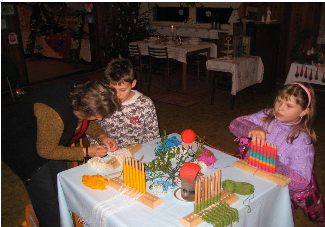
Vánoční výstava- děti zkoušely své umění

V běžném roce bylo počasí u nás více deštivé a méně příznivé pro zemědělce. Hlavně při sušení sena a při žních. Nad naším JZD mělo patronát Vyšší vojenské dělostřelecké učiliště z Hranic a právě vojáci z učiliště velmi pomohli při nepříznivém počasí zvláště při žních. I přes nepřízeň počasí se našemu JZD vcelku vedlo velmi dobře a bylo vyhodnoceno jako nejlepší v živočišné výrobě a od ONV obdrželo putovní vlajku, za což patří dík vedení družstva, jakož i všem družstevníkům, kteří se o to svou poctivou prací zasloužili!.