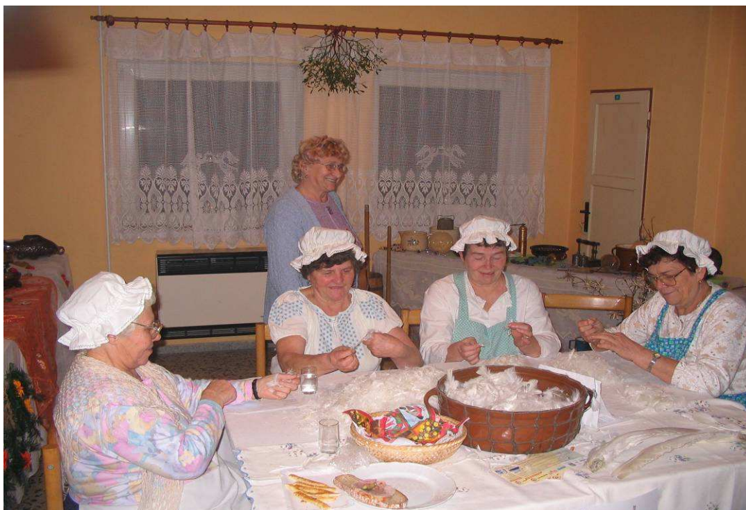
Originál drhačky peří z Libhoště na vánoční výstavě 2008