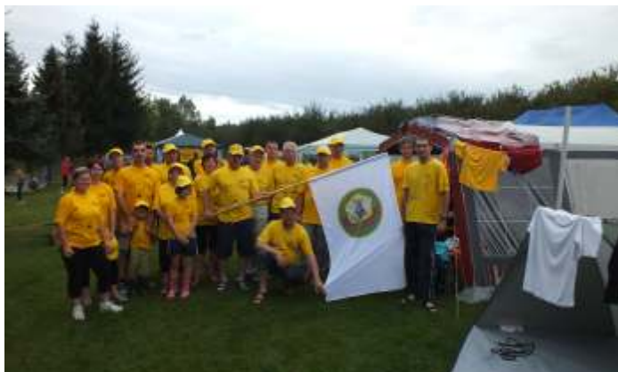
Posádka dračí lodě „Včelí žihadla“

Základní organizace se rozrostla o 3 nové členky a jeden člen se odhlásil kvůli vysokému věku. Bude stále čestným členem naší organizace. Nyní má naše organizace 40 členů a 449 včelstev.