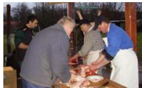
Pravá domácí zabijačka

V pátek 28. prosince ve Skaličce u sokolovny jsme si udělali pravou domácí zabijačku . Pašíka jsme dovezli z Polomu a za chladného rána zabijačka začala.