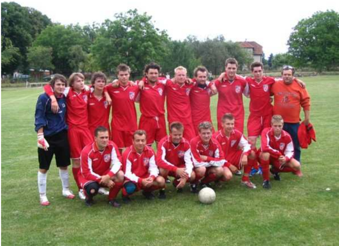
Fotbalový turnaj čtyř obcí o pohár starostky