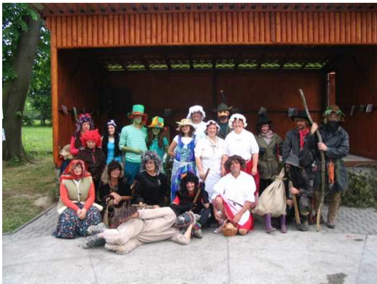
Pohádkový les – červen 2007

Počasí v roce 1956 bylo vcelku příznivé. Na podzim překvapila již počátkem listopadu zima, ale s pomocí STS byla podzimní orba včasné dokončena. Předepsané dodávky byly splněny na 100%. Na státní nákup dodala naše obec 46 q vepřového masa, 44q hovězího masa a 12.540 litrů mléka. V celookresním měřítku se umístila naše obec v dodávkách na výborném 7. místě.