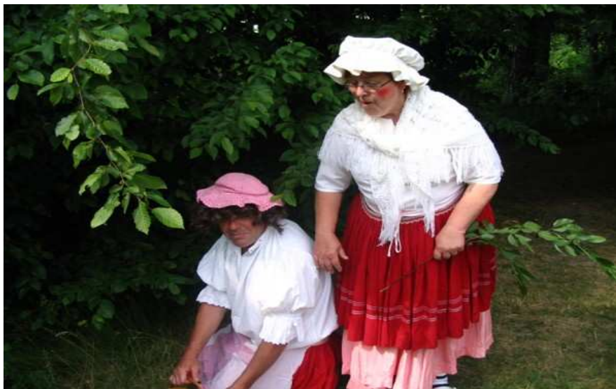
Pohádkový les – červen 2007