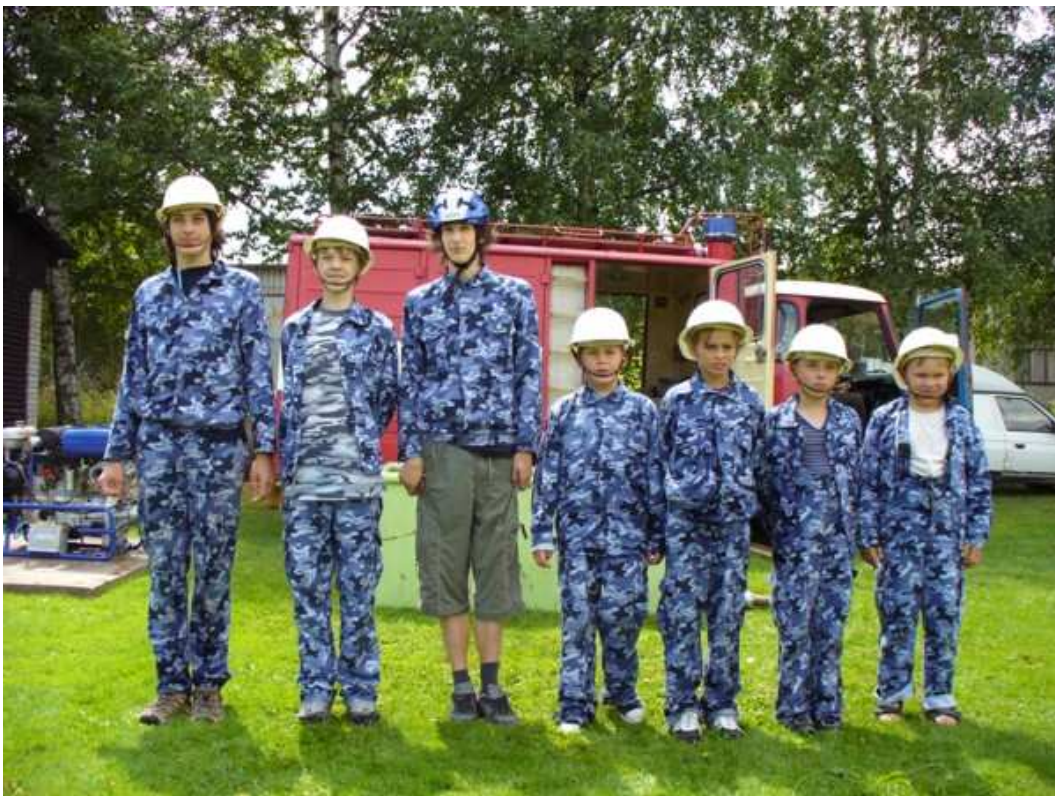
Mladí hasiči ze Skaličky