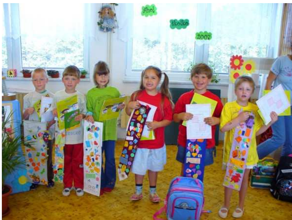
Loučení budoucích prvňáčků z MŠ