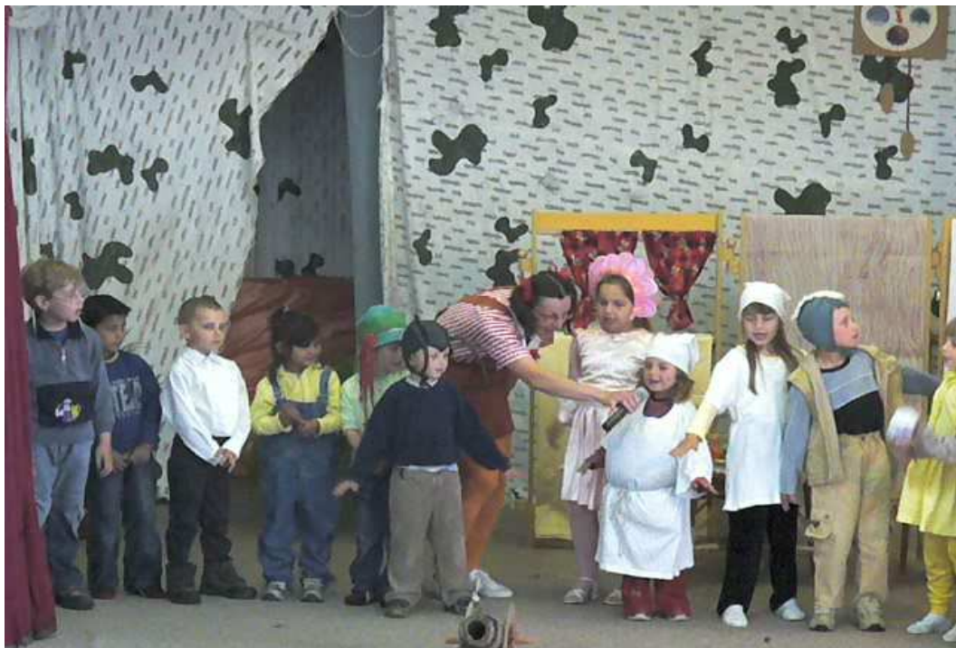
Den matek 2007 – vystoupení dětí se školky